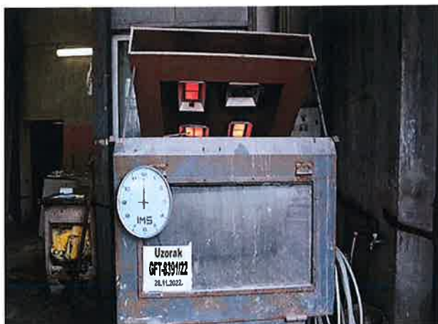
Snimak 1 – Početak ispitivanja