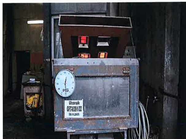
Snimak 2 – Uzorak u 30-om minutu ispitivanja