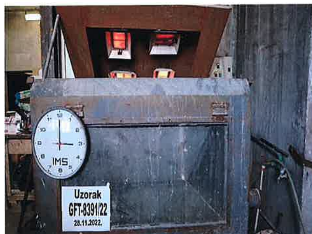
Snimak 4 – Kraj ispitivanja

PRILOG UZ IZVEŠTAJ - Tehnički opis (dostavljeno od strane Naručioca) sadrži 1 (jednu) stranu.