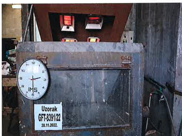
Snimak 3 – Uzorak u 150-om minutu ispitivanja