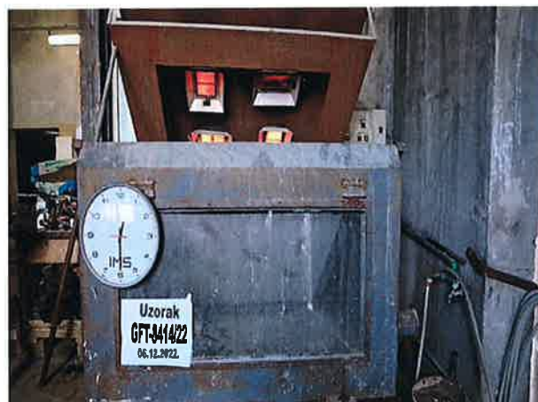
Snimak 2 – Uzorak u 30-om minutu ispitivanja