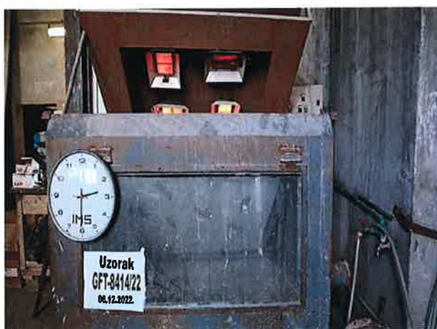
Snimak 3 – Uzorak u 150-om minutu ispitivanja