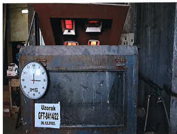
Snimak 4 – Kraj ispitivanja

PRIOLOG UZ IZVEŠTAJ - Tehnički opis (dostavljeno od strane Naručioca) sadrži 1 (jednu) stranu.