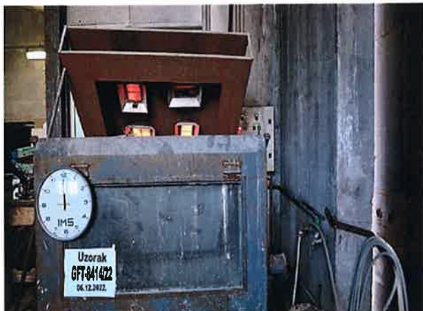
Snimak 1 – Početak ispitivanja